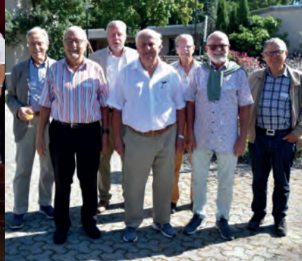
Gesamtbild aller Geehrten.