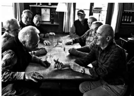
Viel Heiterkeit und ein grosszügiger Ex-Raucher (mit Dächlikappe, hinten rechts) beim Zwischenhalt in Oberkirch.