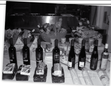
Der Gabentisch - ein wahres «Tischlein-deck-dich»!