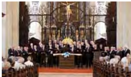
Kurz vor der feierlichen Entrollung der Fahne. Weitere Fotos auf den Folgeseiten.