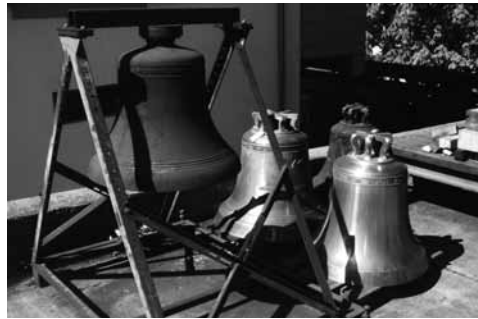
Alt und neu