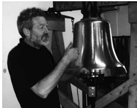
Das Stimmen der Glocke.

1367 wurde in Aarau die erste Glocke gegossen. Heute verlassen jedes Jahr rund 20 Glocken die Firma Rüetschi, jede ist ein Unikat. Vom Vorgespräch bis zum Glockenaufzug vergehen mehr als zwei Jahre. Zuerst wird eine Form aus Lehm hergestellt. Später wird in die Form die 1150 Grad heisse Bronzemasse eingefüllt (71% Kupfer, 29% Zinn). Die Reinheit der Legierung ist wesentlich. Jede Glocke trägt eine Inschrift und eine Jahreszahl.