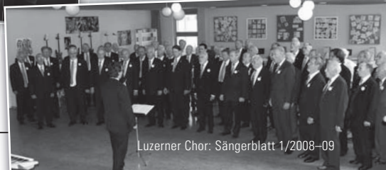
Luzerner Chor: Sängerbblatt 1/2008-09